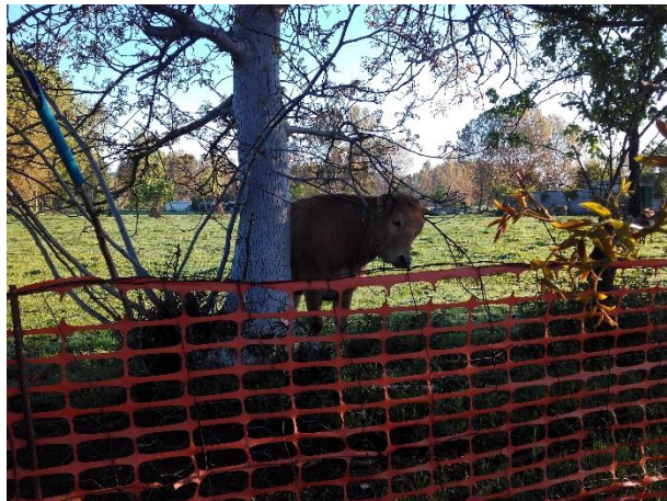
2Proximidades de Camponaraya