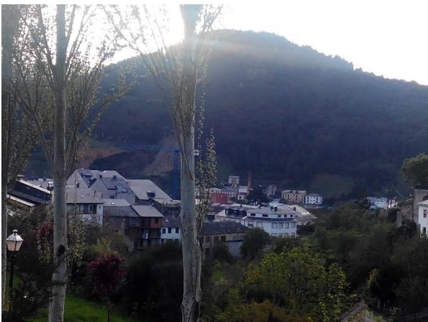
3Villafranca del Bierzo