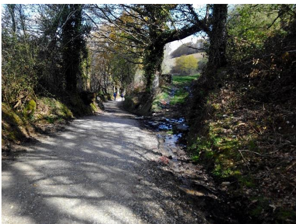
6Entre Fillobas y Pasantes

O Cebreiro - Triacastela: 21,5Km, parcial 74,5, acumulado 644,0