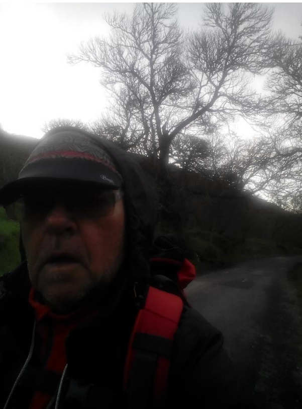
4Antes de Trabadelo

http://caminodesantiago.consumer.es/albergue-de-o-cebreiro