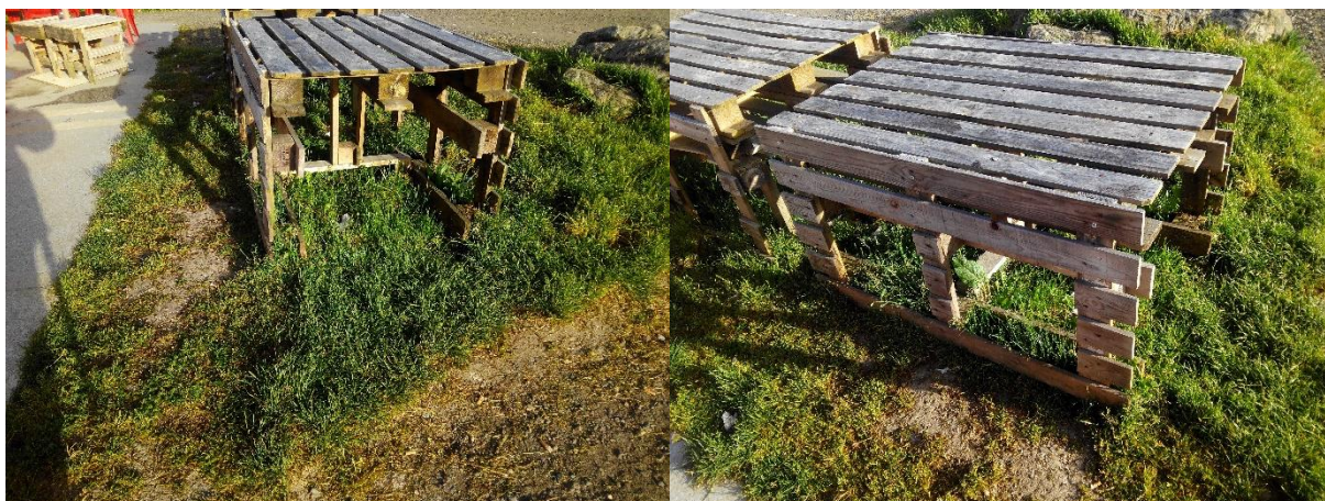
8Mesas del bar de desayuno en Barbadeo

http://caminodesantiago.consumer.es/albergue-de-portomarin