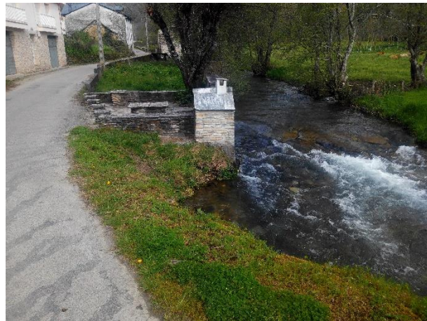
5Las Herrerías,, al comienzo de la subida