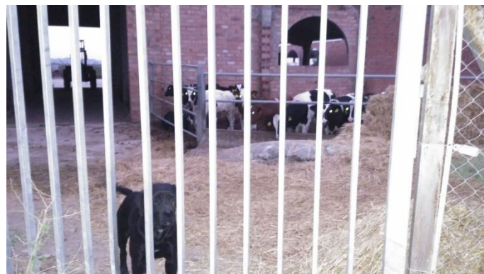
Ganado antes de Balaguer e indicador a la salida

poco después del amanecer veo tractores saliendo de la ciudad, después inferiré que han ido para bloquear diferentes carreteras por Catalunya. Pienso que no habrá nada o casi nada abierto así que decido desayunar a la primera oportunidad y lo hago en una bar que lleva una francesa, fantástico bocata de atún y “café au lait” y he hecho bien, no hubiera habido una segunda oportunidad pues hay que cruzar toda la ciudad y se ve gente pero no actividad. Camino a Algerri se pasa por Castello de Farfanya donde unos simpáticos viejitos me corrigen y me