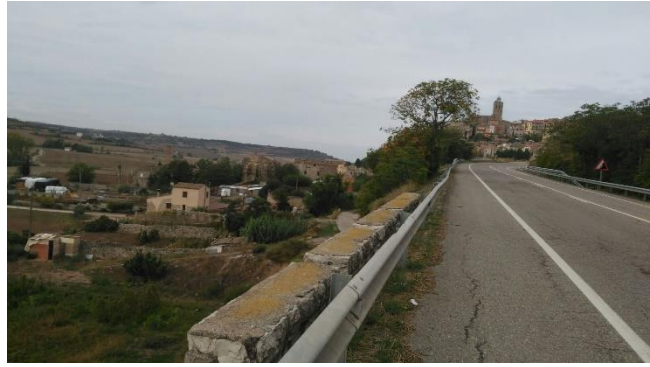
Desayuno en Cervera y Cervera a la vista

https://es.wikiloc.com/wikiloc/spatialArtifacts.do?event=setCurrentSpatialArtifact&id=20169516