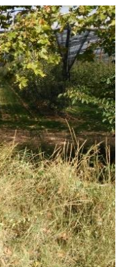
Muchos frutales y también algo de ganado llegando a Linyola

https://es.wikiloc.com/wikiloc/spatialArtifacts.do?event=setCurrentSpatialArtifact&id=20169620