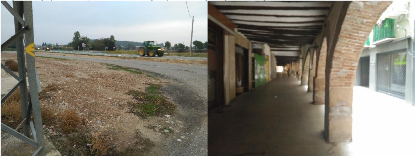
Tractores saliendo de Balaguer y solitaria calle -hoy- del centro histórico